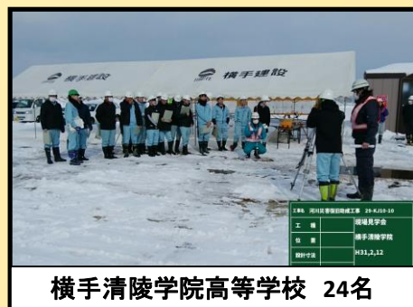
横手清陵学院高等学校 24名