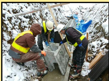
積ブロック施工状況