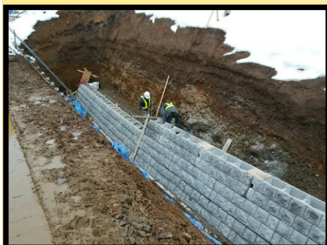
積ブロック施工状況