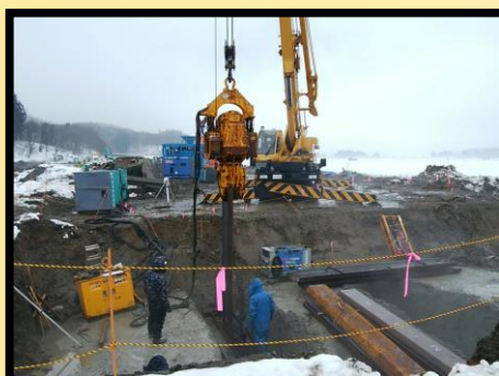
止水矢板打込み状況