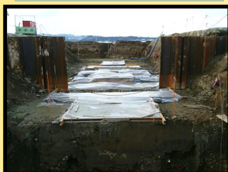
樋管工 均しコンクリート打設