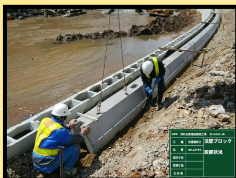
法留ブロック設置状況