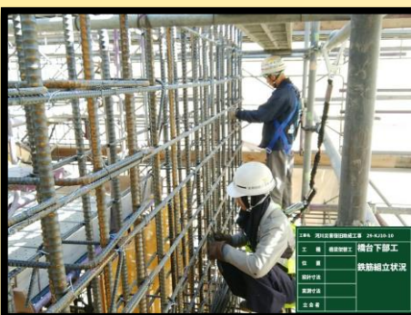
橋台工 鉄筋組立て状況