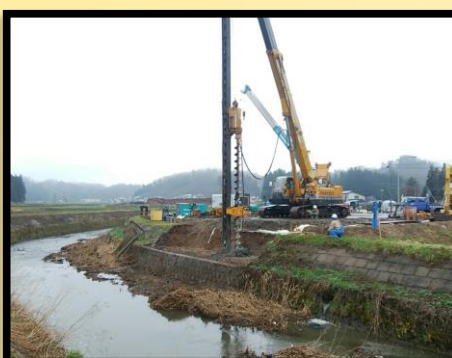
仮設工 仮橋施工状況