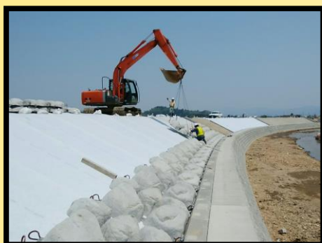
護岸工 張りブロック設置状況