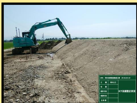
盛土工 ICT法面整形状況