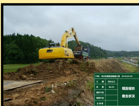
切土工 既設堤防撤去状況