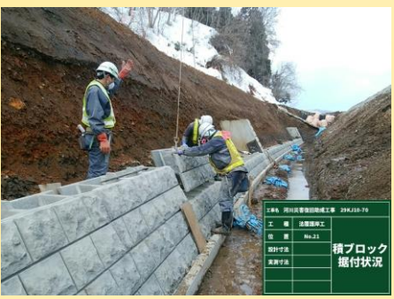
積ブロック 据付状況