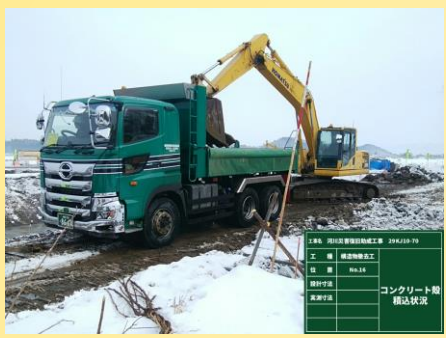
コンクリート殻 搬出状況