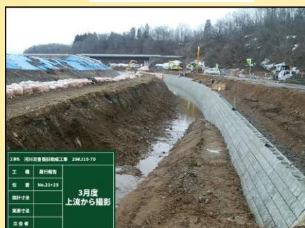
施工終点埋戻し 施工状況