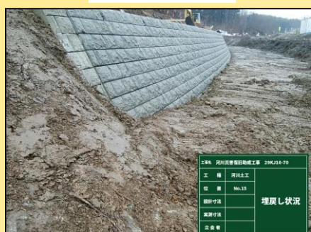
施工起点埋戻し 施工状況