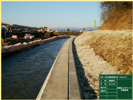
法留ブロック 施工状況