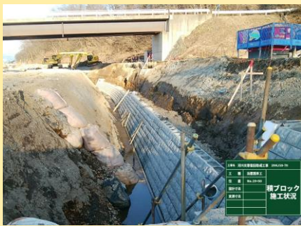
コンクリート積ブロック 施工状況