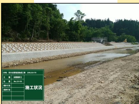
ブロック張 施工状況