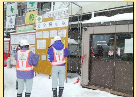
女性パトロール実施状況

現場事務所敷地内には、男女別の水洗トイレを設置しております。ご自由にご使用ください。