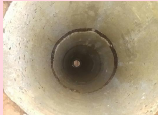
アスベスト除去 完了