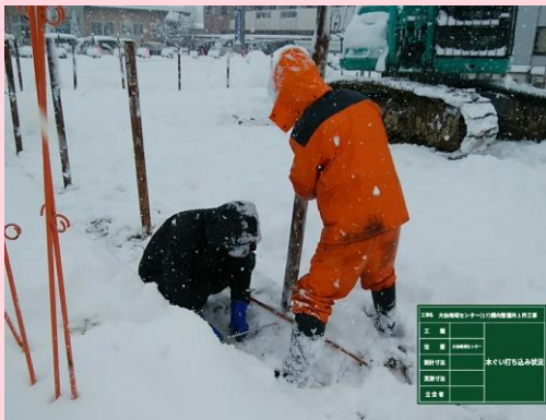
侵入防止柵(木杭打ち込み)