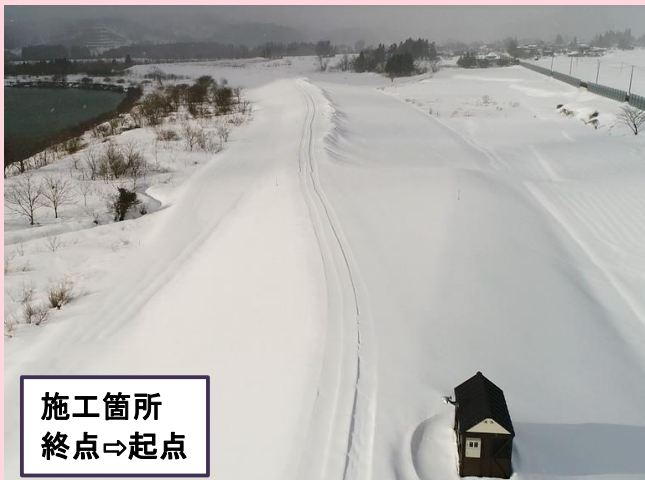
施工箇所 終点⇒起点

日頃より工事にご協力頂き、誠にありがとうございます。 今月の作業予定は下記のようになっておりますので、お知らせいたします。