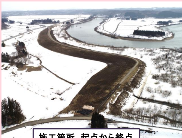
施工箇所 起点から終点

日頃より工事にご協力頂き、誠にありがとうございます。 今月の作業予定は下記のようになっておりますので、お知らせいたします。