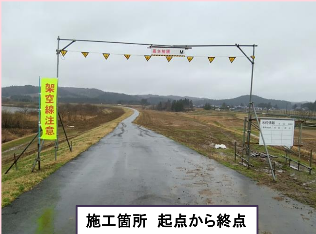
施工箇所 起点から終点

日頃より工事にご協力頂き、誠にありがとうございます。 今月の作業予定は下記のようになっておりますので、お知らせいたします。