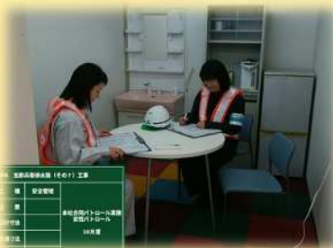
女性専用ルームでの結果まとめ