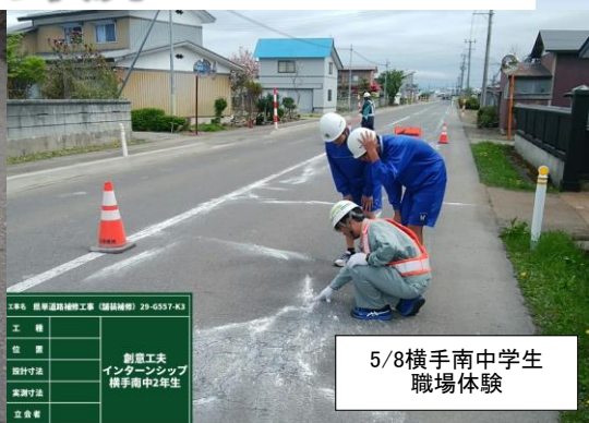
5/8横手南中学生 職場体験