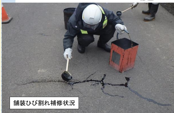
舗装ひび割れ補修状況