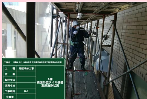
A棟 西面外壁タイル高圧洗浄