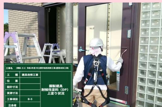
高架水槽室 鋼製建具枠塗装