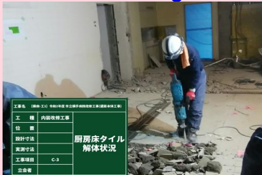
厨房 床タイル解体