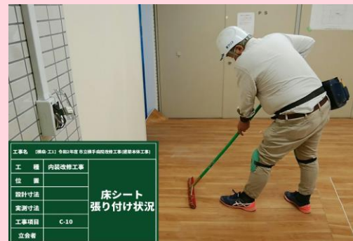
B棟1階 地域医療連携相談室 床シート張り