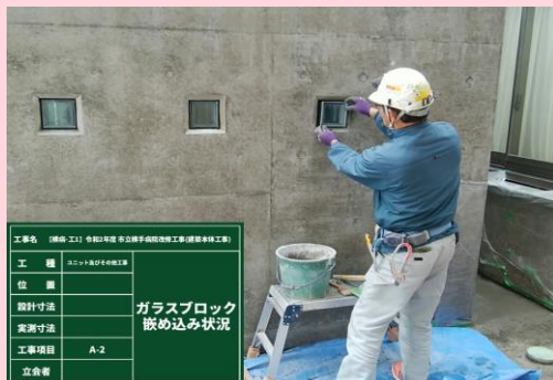
C棟防雪壁 ガラスブロック嵌め込み