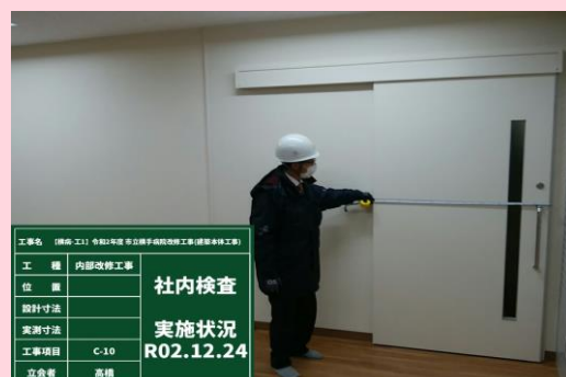
B棟1階 地域医療連携相談室 完成