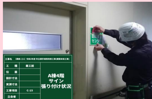
A棟4階 サイン張り付け