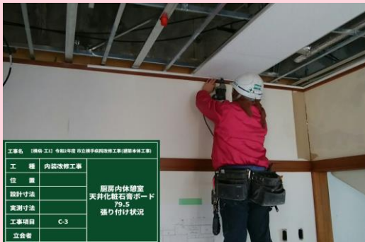
厨房 天井ボード張り付け