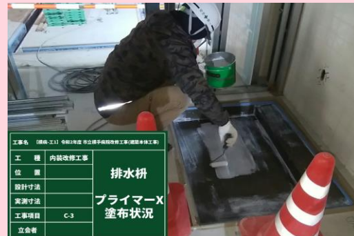
厨房 側溝防食作業