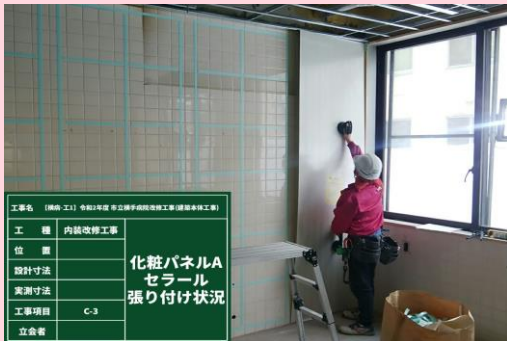
厨房 壁仕上げ張り