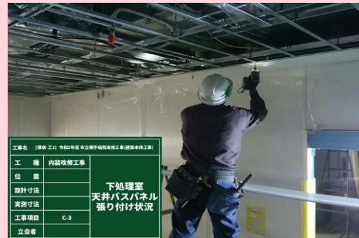
厨房 天井仕上げ張り