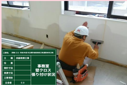
厨房 壁仕上げ張り