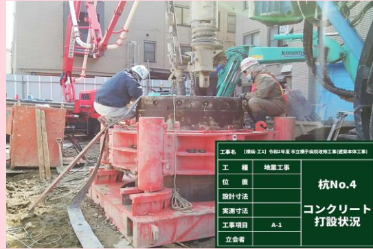
公園口キャノピー部 場所打ちコンクリート杭 施工状況