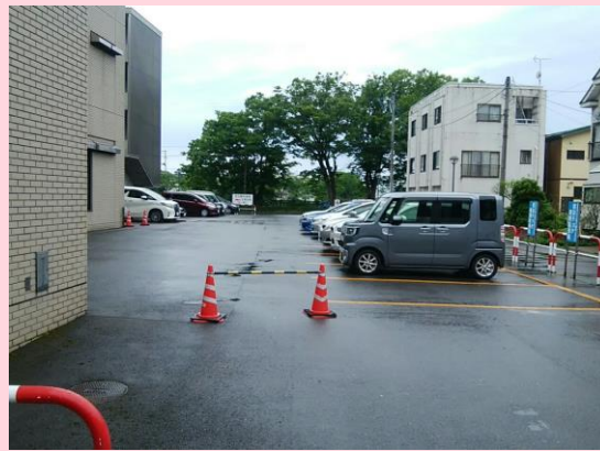
オイルタンク新設 着工前