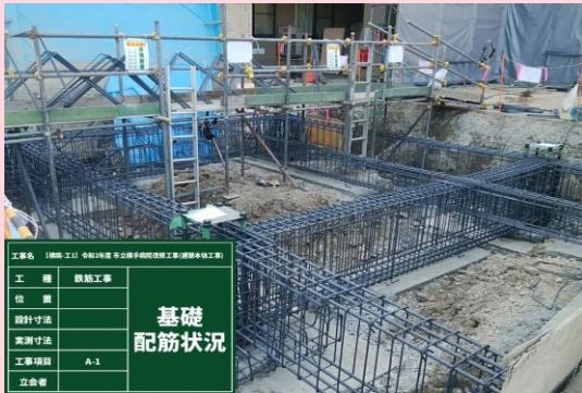
公園口キャノピー部 基礎配筋状況