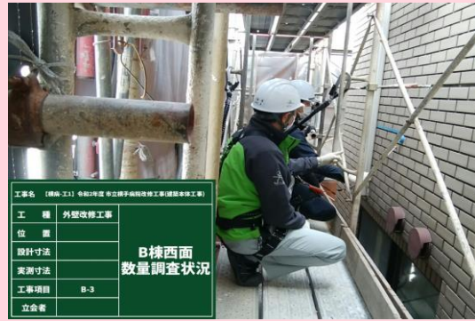
B棟外壁タイル 数量調査状況