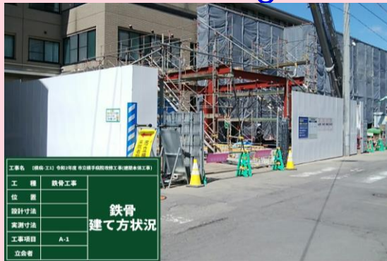
公園口キャノピー部 鉄骨建て方状況