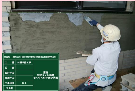
B棟東面 外壁タイル張替え状況