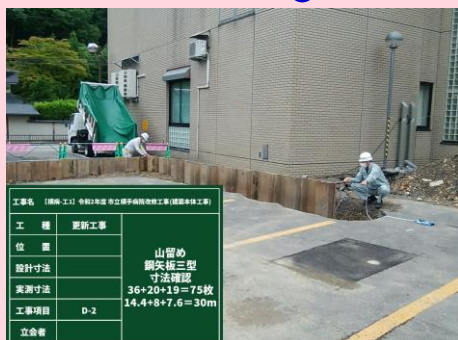
山留め 鋼矢板寸法確認