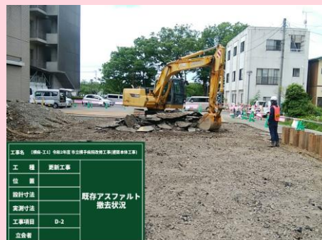
既存アスファルト撤去状況