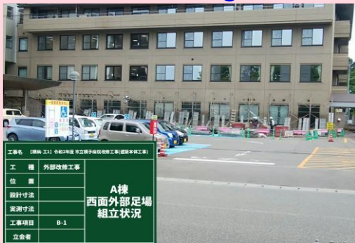
A棟 西面外部足場組立状況