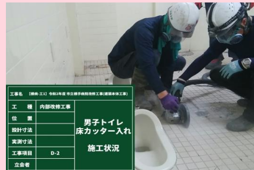
A棟4階 男子トイレ 床カッター入れ 施工状況