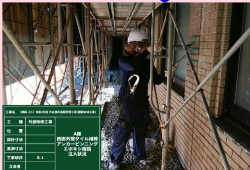
A棟 西面外壁タイル補修