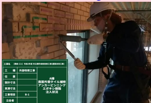
A棟 南面外壁タイル補修