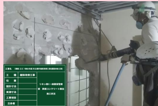
A棟1階 リネン室C 一部RC壁撤去状況