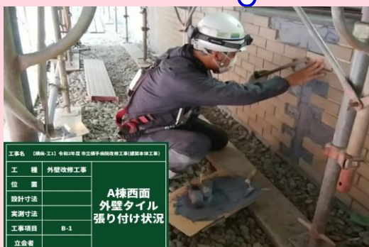
A棟 西面外壁タイル張替え