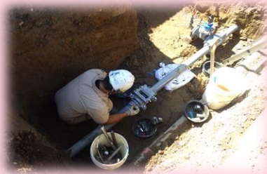
仮設上下水道管工 施工状況

只今、仮設上下水道管工が完了し、樋門・樋管のコンクリート構造物を施工しています。