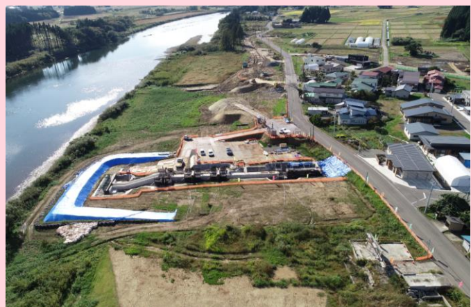
ドローン撮影写真