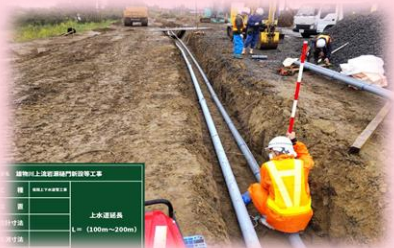
仮設上下水道管工 出来形検測

日頃より工事にご協力頂き、誠にありがとうございます。 今月の作業予定は下記のようになっておりますので、お知らせいたします。