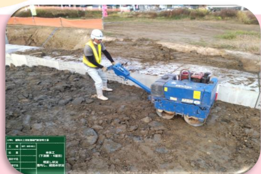
河川土工 本体部埋戻し転圧状況