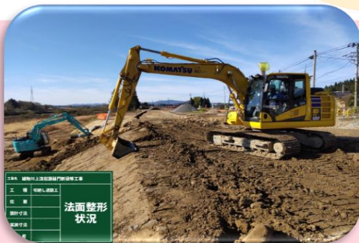
切廻し道路工 法面整形状況

日頃より工事にご協力頂き、誠にありがとうございます。 今月の作業予定は下記のようになっておりますので、お知らせいたします。