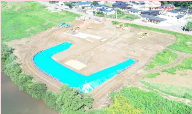
ドローン撮影写真

只今、土留・仮締切工及び 床掘りを完了しました。 次工程は、樋門・樋管本体工 (矢板工) を施工します。