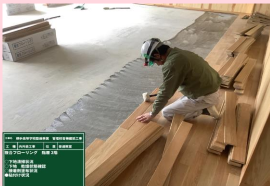
内外装工事 フローリング 貼付け状況