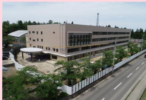
ドローンによる上空からの撮影