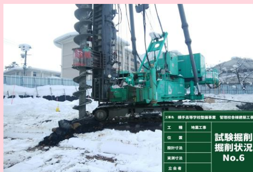
地業工事 試験掘削状況