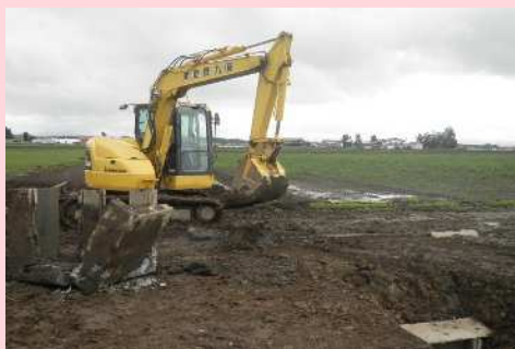
道路工【既設水路の撤去】