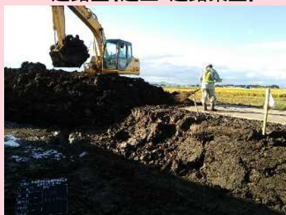
道路工【運土・道路築立】