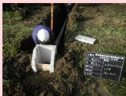
排水路工【田面排水路 据付】