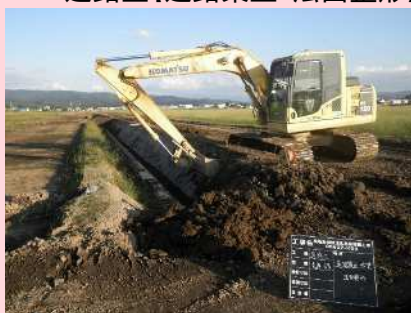
道路工【道路築立・法面整形】