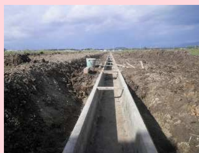
用水路工【用水路 据付】