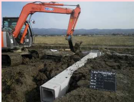
【最後の水路布設状況】