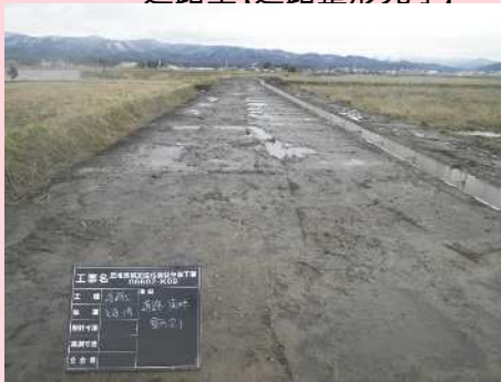
【最後の水路布設状況】