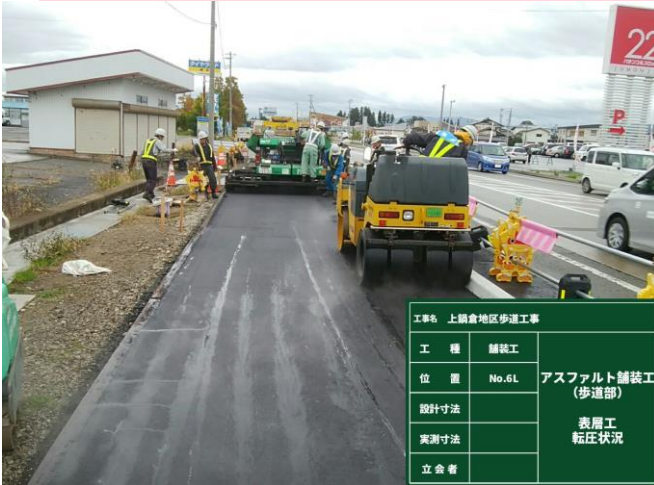
アスファルト舗装 転圧状況