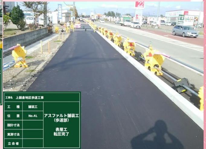
アスファルト舗装 転圧完了