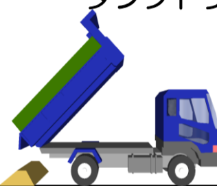
ダンプトラック (2・4t)