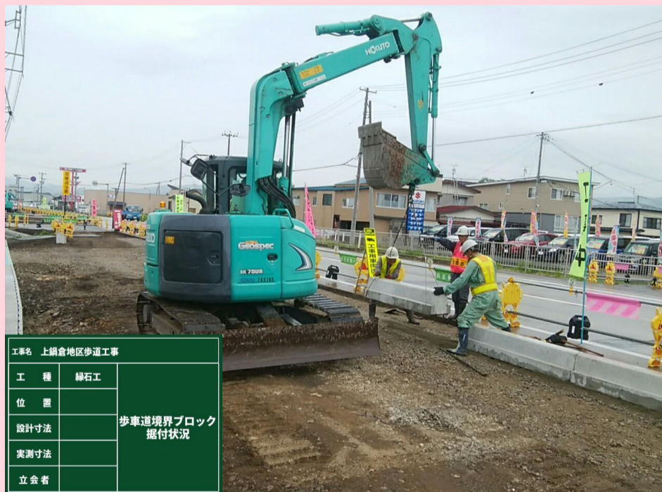
歩車道境界ブロック 据付状況