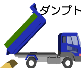
ダンプトラック (2・4t)