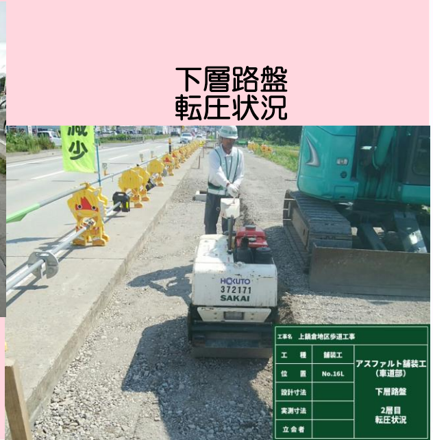
下層路盤 転圧状況